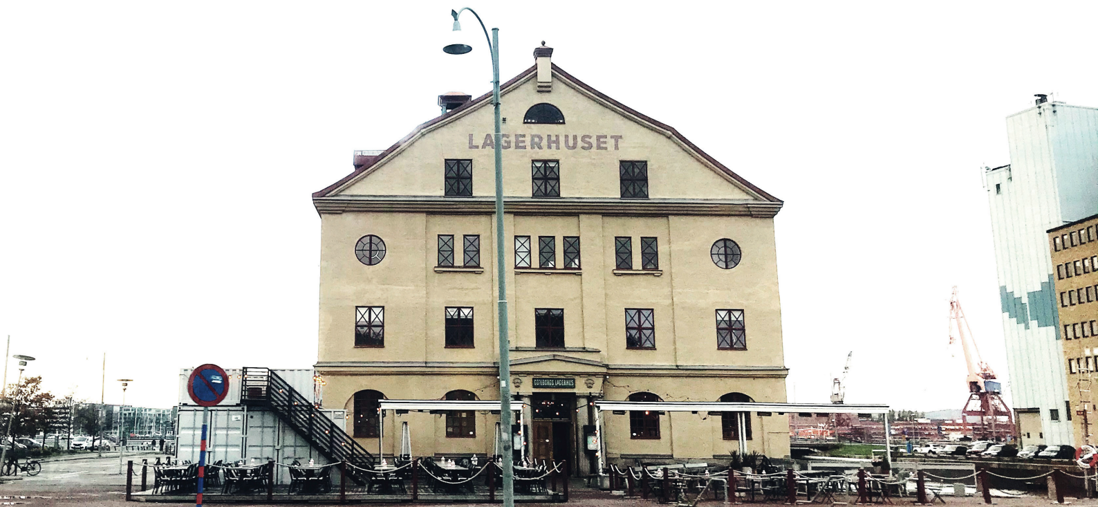
Lagerhuset ligger i centrala Göteborg, på Heurlins plats 1. Närmsta hållplats är Järntorget.